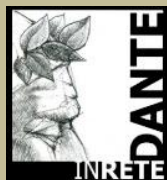
DANTE IN RETE